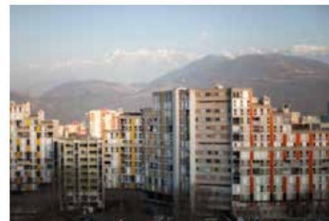
© Vill9 la série, Bram Goots

« BazarUrbain est né à la fin des années 1990, sous la forme d'un collectif composé de personnes issues de la recherche en architecture, urbanisme ou encore sociologie à Grenoble. Nous travaillons habituellement pour des maîtres d'ouvrage sur des études ou des projets avec un lien fort au récit habitant, à la représentation du projet. De plus en plus, nous produisons des articles ou des livres, des émissions de radio, et nous rendons publics des films.